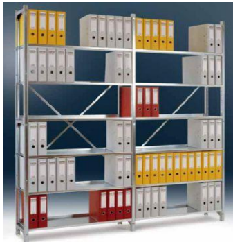
Abbildung: Grundregal und Anbauregal