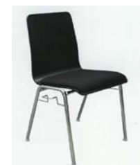
1001 ST-S mit Sitzpolster