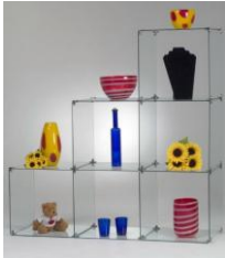
Vitrine mit 6 Feldern