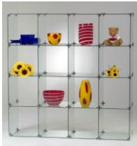
Vitrine mit 16 Feldern