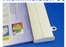
36 mm Profil