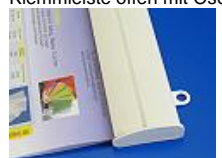
36 mm Profil mit Endkappe und Öse