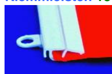
18 mm Profil