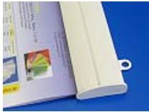
36 mm Profil