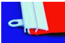
18 mm Profil