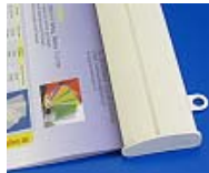
36 mm Profil mit Endkappe und Öse