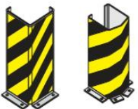
L - Form U - Form