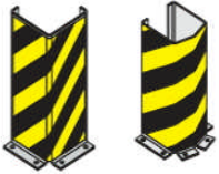
L - Form U - Form