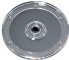
Drehteller transparent 15,0 cm