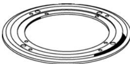
KDE 009, 012