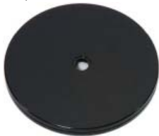
Drehteller schwarz 15,0 cm