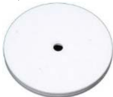
Drehteller weiß 15,0 cm