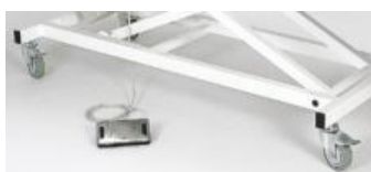
4 Laufrollen, einzeln feststellbar

Alle Preise zzgl. MwSt. Mindestbestellwert 50.- €. Lieferung an gewerbliche Kunden