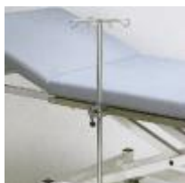
Infusionsstange / Kloben