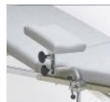
Armauflage Mod. 1440