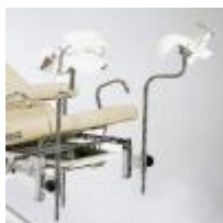
Beinhalter Standard Mod. 1510