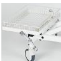
Ablagekorb Mod. 1850