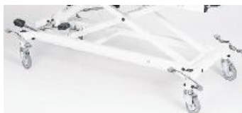
4 Rollen, zentral feststellbar (Standard)