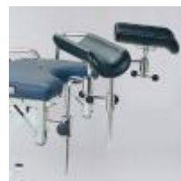
Beinhalter nach Göbel 1520