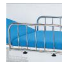
Seitengitter – steckbar 1010