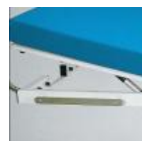
OP-Schiene für Zubehör