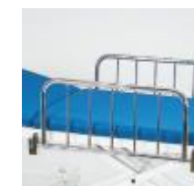
Seitengitter – klappbar 1040