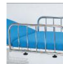
Seitengitter – steckbar 1010