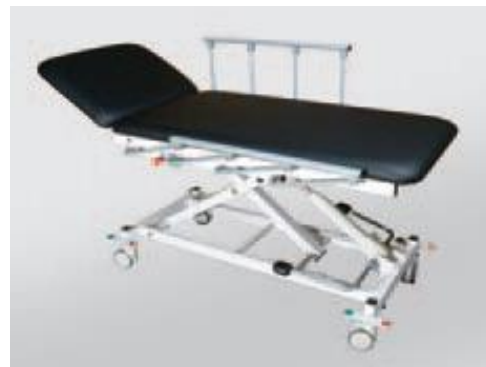
Optional: DX1-H mit Seitengitter, versenkbar, silber beschichtet, Länge: 820 mm (Mod. 1008)