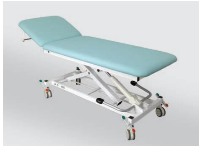
- starke Hydraulikpumpe mit großer Übersetzung dadurch leichte Betätigung auch bei höheren Gewichten