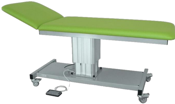
Abb. mit Zubehör: Rollen 75 mm diam., einzeln feststellbar (4x Mod. 1100), dann Höhe: 650 mm - 1.050 mm