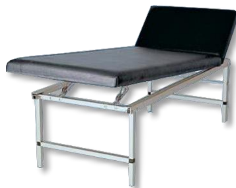
Kopf- und Fußteil verstellbar