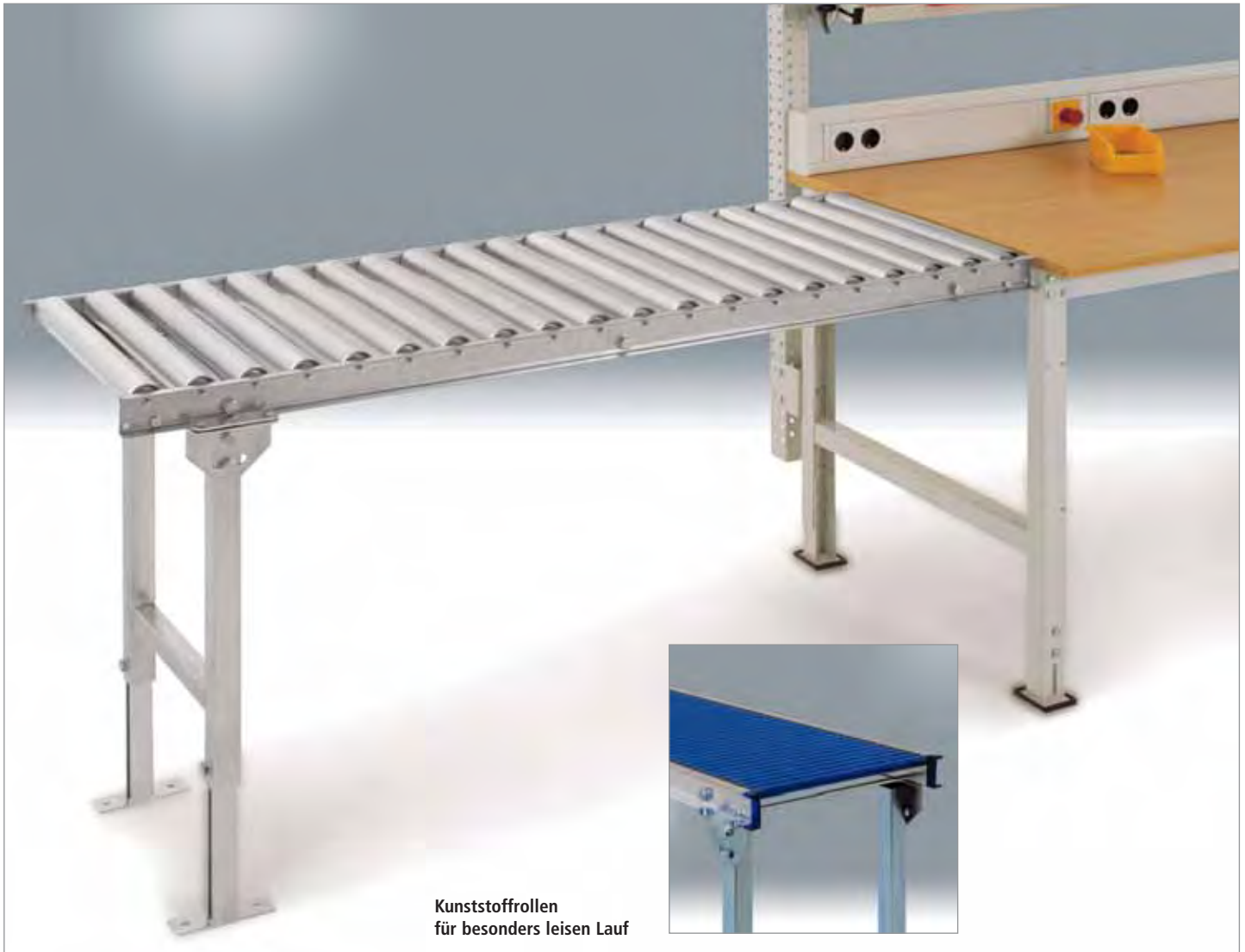
Kunststoffrollen für besonders leisen Lauf