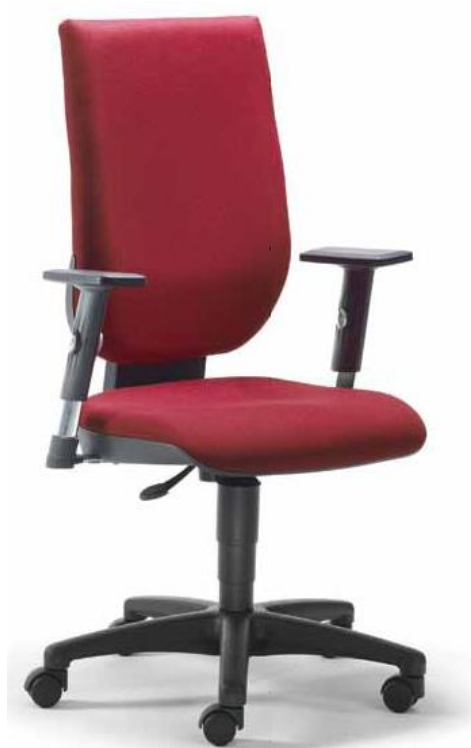
2277 AV, 26 271

Ausgereifte Technik und ausgesuchte Materialien machen TERTIO zu einem hochfunktionellen Drehstuhl. Design Jean Louis Iratzoki