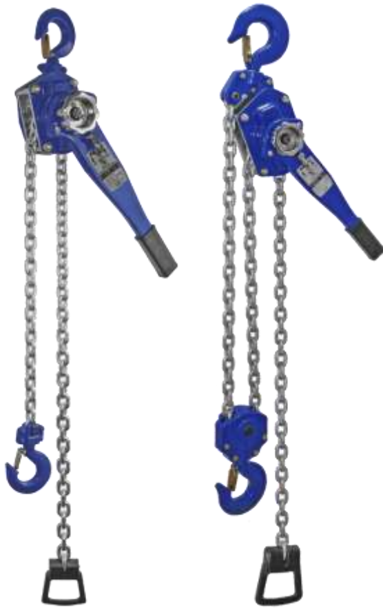
PLX II 1,5 T