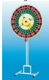
Glücksrad mit Erhöhung