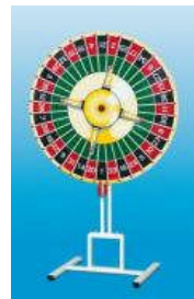
Glücksrad klein mit Erhöhung