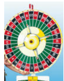
Stopper oben mit Aufsatzteil