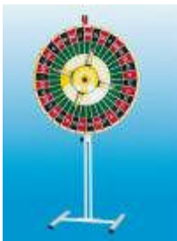
Glücksrad Standard mit Aufsatzstopper