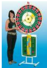
Glücksrad mit Werbeplatte, Aufsatz und Erhöhung