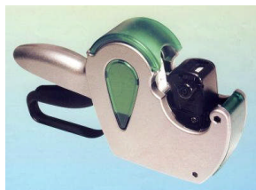
Preisauszeichner Sky Farbe: silber

Diesen Preisauszeichner gibt es mit vielen Variationsmöglichkeiten. Er ist einfach in der Handhabung und daher schnell und unkompliziert einsetzbar.