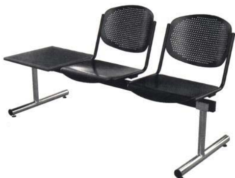
Abbildung: 2121 L-T

2121 L Traverse 2-sitzig 2121 L-T Traverse 2-sitzig + Tisch 2131 L Traverse 3-sitzig 2131 L-T Traverse 3-sitzig + Tisch 2141 L Traverse 4-sitzig 2141 L-T Traverse 4-sitzig + Tisch 2151 Traverse 5-sitzig