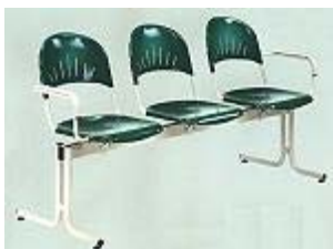
Modell 2130/10 L