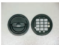
Abb. DFS SB Schloß Art. Nr. 53623