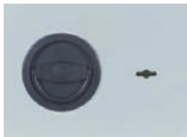
Klappgriff DB Standard