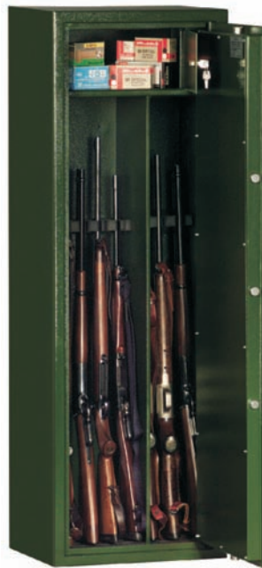
Art. 53601 kompl. m. Waffen

Standardlackierung: RAL 7035 grau bzw. RAL 6020 grün (bitte bei der Bestellung angeben!) Sonderlackierung gegen Aufpreis möglich!