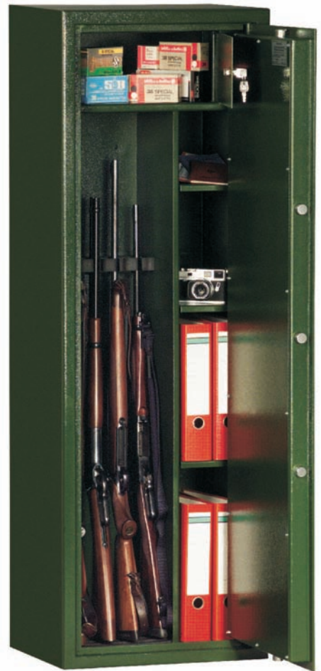
Art. 53601 als Kombischrank (Standard) 4 Waffenhalter, 3 Fachböden 4 Waffenhalter lose zum nachtr. Einbau (s. kleines Foto) serienmäßig.