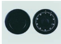
Mechanisches ZK Schloß Art. Nr.: 53622