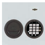
DFS SB Schloß mit mechanischer Revision Art. Nr. 53624