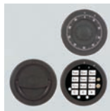
DFS SB Schloß mit mechanischer Revision Art. Nr. 53625

Sonder- Maße u. Ausführungen gegen Mehrpreis lieferbar