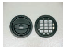
Abb. DFS SB Schloss Art. Nr.: 53523