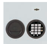
DFS SB Schloss mit mechanischer Revision Art. Nr. 53524