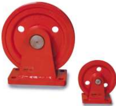
Drahtseilblock DSB Premium

Viele verschiedene Ausführungen der DSR Premium machen Ihnen das Umlenken von Seilen leicht. Die zum Seil passend gedrehten Seilrillen sorgen für einen schonenden Seillauf. Besonders geeignet für Elektroseilwinden ist der DSB Premium. Mit seinen verschiedenen Seil- und Rollendurchmessern zeigt er sich als kraftvoller Allrounder, der Lasten bis 5 t bewegt und Umlenken bis 180° möglich macht. Eine präzise auf den Seildurchmesser abgestimmte Seilrille gewährleistet verschleißfreien Seillauf.