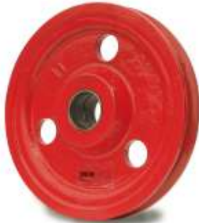
Drahtseilrolle DSR PREMIUM

Viele verschiedene Ausführungen der DSR Premium machen Ihnen das Umlenken von Seilen leicht. Die zum Seil passend gedrehten Seilrillen sorgen für einen schonenden Seillauf. Besonders geeignet für Elektroseilwinden ist der DSB Premium. Mit seinen verschiedenen Seil- und Rollendurchmessern zeigt er sich als kraftvoller Allrounder, der Lasten bis 5 t bewegt und Umlenken bis 180° möglich macht. Eine präzise auf den Seildurchmesser abgestimmte Seilrille gewährleistet verschleißfreien Seillauf.