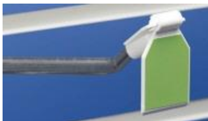
Pendelclip Einhängung für Adapter