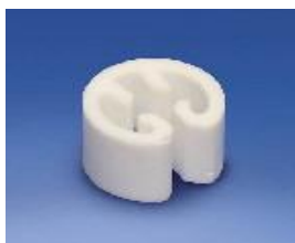
Begrenzungsclip für Einfachhaken