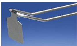
Pendelclip aus Metall