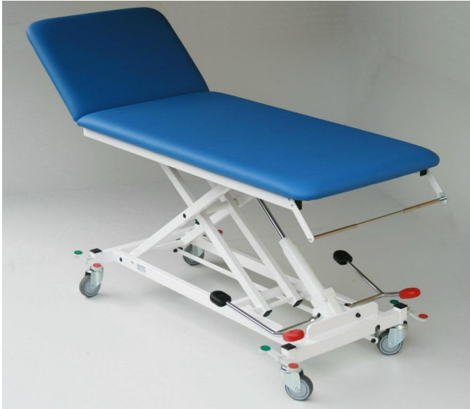
Abb. mit Zubehör: Rollen 100 diam., zentral feststellbar (Mod. 1180), Papierrollenhalter (Mod. 1270K)