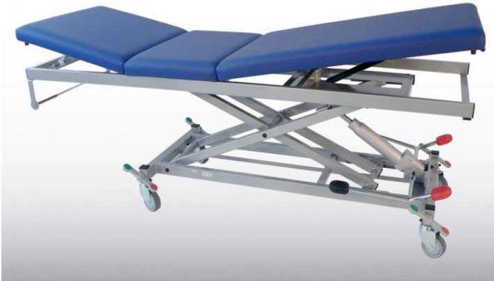
Abb. mit Zubehör: Rollen zentral feststellbar (Mod. 1181), Papierrollenhalter (Mod. 1265/K)

Variante 1: Manuell höhenverstellbar durch Hydraulikpumpe, Tritthebel zur Fußbedienung beidseitig der Liegefläche.