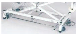
Umlaufender Fußauslöserahmen, verchromt Mod. 1960