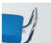
Schiebegriff Mod. 1810