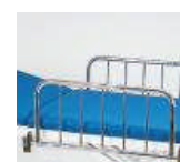
Seitengitter – klappbar 1040