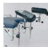
Beinhalter nach Göbel 1520