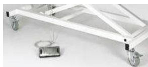
4 Laufrollen, einzeln feststellbar

Alle Preise zzgl. MwSt. Mindestbestellwert 50.- €. Lieferung an gewerbliche Kunden