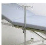
Infusionsstange / Kloben