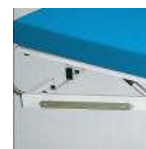
OP-Schiene für Zubehör