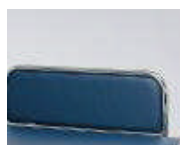
Seitengitter – gepolstert