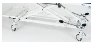
4 Comfort-Rollen, zentral feststellbar Mod. 1185