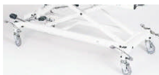
4 Rollen, zentral feststellbar (Standard)