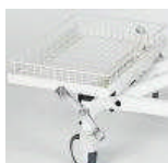
Ablagekorb Mod. 1850