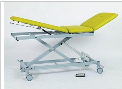
Bild : Mod. 1050-04 mit Zubehör: Fahrbar auf 4 Doppel-Rollen ø 100 mm, zentral feststellbar (Mod. 046)