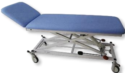
Abb. mit Zubehör: Comfort-Rollen 125 mm diam., zentral feststellbar (Mod. 1185)