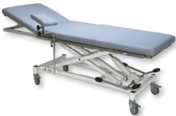
Abb. mit Zubehör: 1 Normschiene 1.300 mm lang (Mod. 1420) und 1 Armauflage (Mod. 1440)