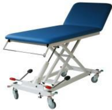
Abb: mit Zubehör: Rollen 100 diam., zentral feststellbar (Mod. 1180), Papierrollenhalter (Mod. 1270K)