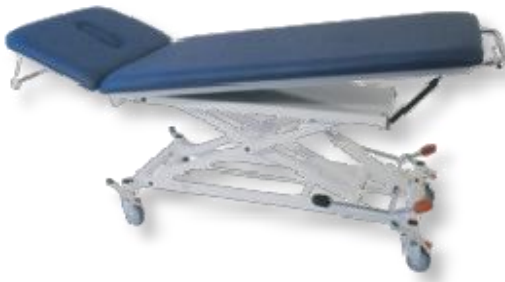
Abb. mit Zubehör: - Rollen zentral feststellbar (Mod. 1180) dann H: 600 - 930 mm - Papierrollenhalter (Mod. 1270K) - Sonderschiebegriff (Mod. 1812)