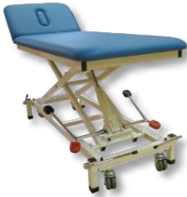
Abb. als hydraulische Variante (mit Zubehör)