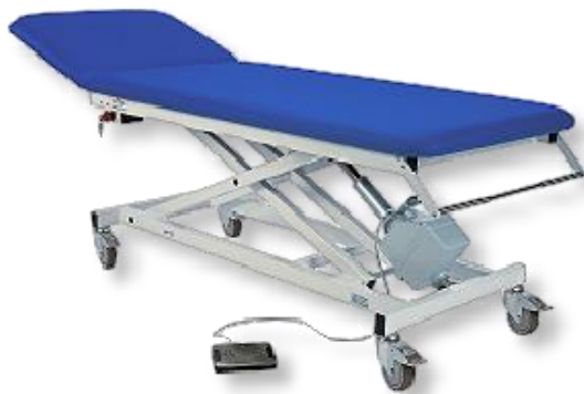
Abb. mit Zubehör: Rollen einzeln feststellbar 100 mm diam., (4x Mod. 1120), Papierrollenhalter (Mod. 1270F)