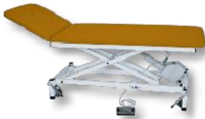
Abb. mit Zubehör Rad-Hebe-System