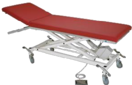
Abb. mit Zubehör: Rollen zentral feststellbar (Mod. 1181)