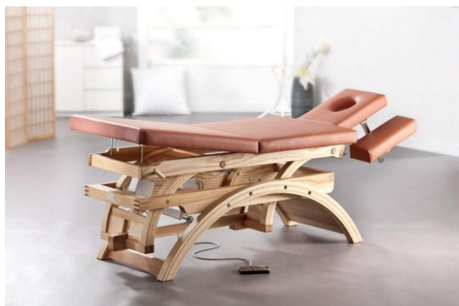
Gestell: Esche natur

Neben den technischen Details besticht diese Massageliege durch ihre wunderschöne Formgebung.