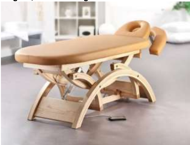
Gestell: Esche natur

Eleganz, höchster Liegekomfort und Stabilität vereint in einer Massageliege der besonderen Art.