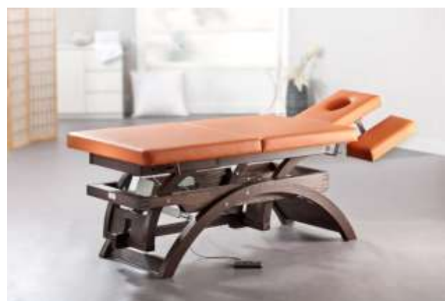
Gestell: Esche gebeizt