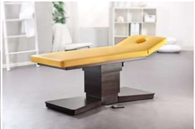
Gestell: Buche gebeizt