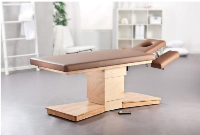
Gestell: Buche natur

Elektrisch höhenverstellbare Liege mit kniefreiem Raum und Mittelhubsäule.