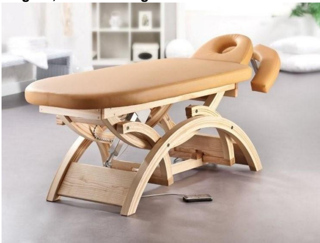
Gestell: Esche natur

Eleganz, höchster Liegekomfort und Stabilität vereint in einer Massageliege der besonderen Art.