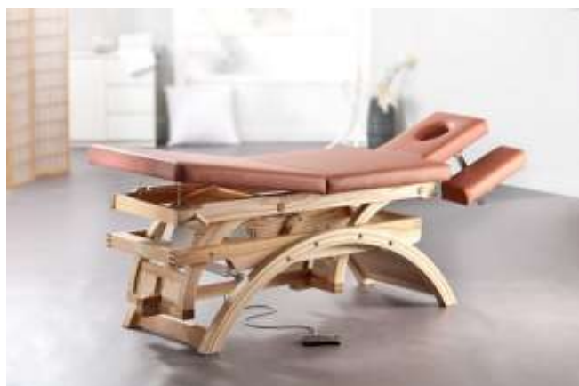
Gestell: Esche natur

Neben den technischen Details besticht diese Massageliege durch ihre wunderschöne Formgebung.