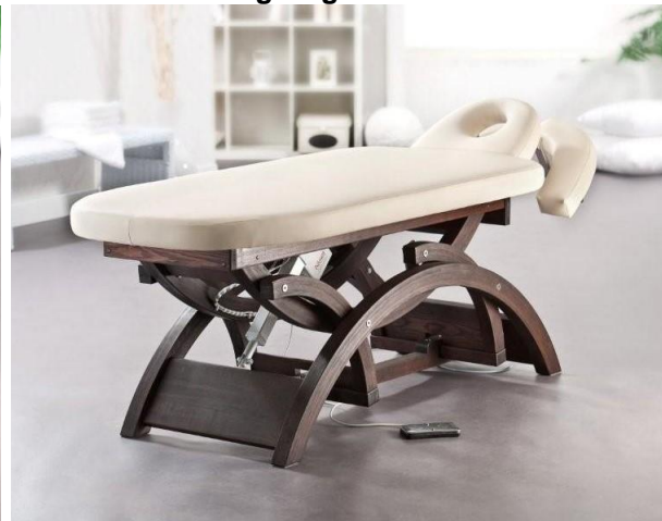
Gestell: Esche gebeizt

Diese stationäre Massageliege ist ein Blickfang in jeder Praxis, jedem Massagestudio und in jedem Wellnesshotel. Ob in Esche natur oder Esche gebeizt – genießen Sie mit Lady Mary höchsten Komfort.