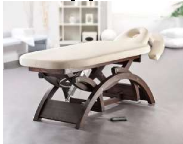
Gestell: Esche gebeizt

Diese stationäre Massageliege ist ein Blickfang in jeder Praxis, jedem Massagestudio und in jedem Wellnesshotel. Ob in Esche natur oder Esche gebeizt – genießen Sie mit Lady Mary höchsten Komfort.