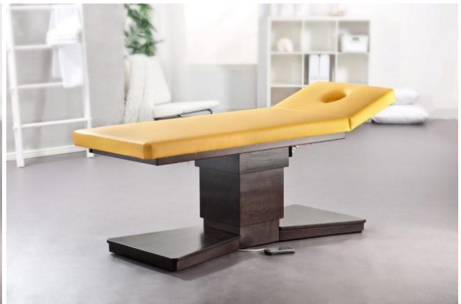
Gestell: Buche gebeizt