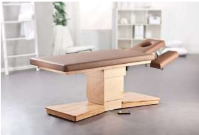
Gestell: Buche natur

Elektrisch höhenverstellbare Liege mit kniefreiem Raum und Mittelhubsäule.