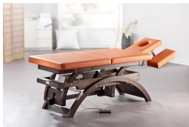
Gestell: Esche gebeizt