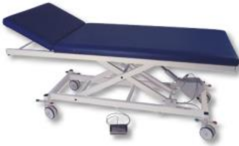
Abb. mit Zubehör: Schwerlastrollen 125 mm diam., zentral feststellbar (Mod. 1189)