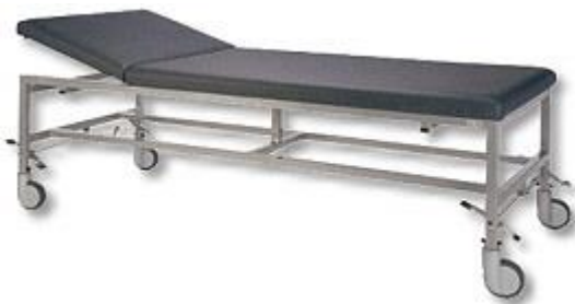
Abb. mit Zubehör: Schwerlastrollen 125 mm diam., zentral feststellbar (Mod. 1189)