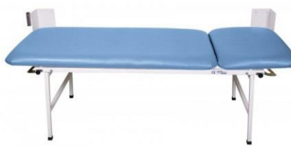
Hellblau 2-teilig Untersuchungsliege UM-0146-MBL Ruheraumliege UM-0146-227 MBL