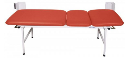
Rot 3-teilig Untersuchungsliege UM-0143-RO Ruheraumliege UM-0143-227 RO