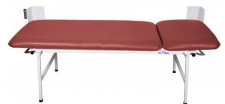
Braunorange 2-teilig Untersuchungsliege UM-0146-BOR Ruheraumliege UM-0146-227BOR