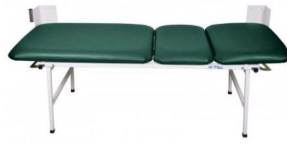
Grün 3-teilig Untersuchungsliege UM-0143-TGR Ruheraumliege UM-0143-227 TGR