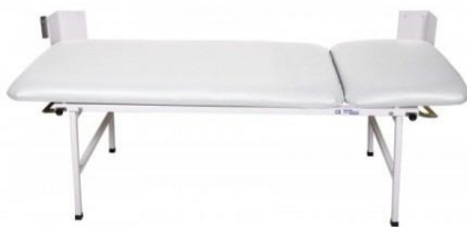
weiß 2-teilig Untersuchungsliege UM-0146-WE Ruheraumliege UM-0146-227 WE