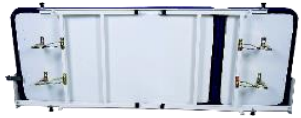
Liege hochgeklappt ultraCLAP "200" Wandklappliege Untersuchungs-liege, 2-teilig, Abmessungen: 1.900 x 700 x 680 mm, Gewicht 43,6 kg

Bei Bedarf blitzschnell einsatzbereit: Sicherung lösen, Beine ausklappen und absenken, fertig. Nach Gebrauch einfach die Beine einklappen, Liegefläche gegen die Wand hochklappen und Sicherungshebel einrasten lassen - schon ist wieder Platz geschaffen. Das ist der große Vorteil dieser Wandklappliege ultraCLAP.