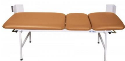
Mittelbraun 3-teilig Untersuchungsliege UM-0143-MBR Ruheraumliege UM-0143-227 MBR