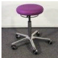
411-02 und 412-02