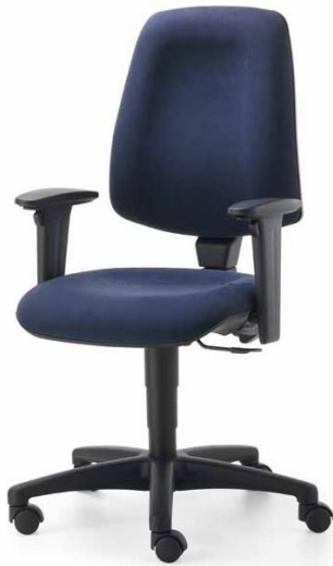
2213 S AV, 26 382

Gesund sitzen muß nicht teuer sein. Der Muldensitz bietet seitlichen Halt. Der Formrücken ist mit integrierter Lendenwirbelstütze . Die Formgestaltung der Sitzfläche mit Beckenstütze bewirkt die Aufrichtung des Beckens und der Wirbelsäule.