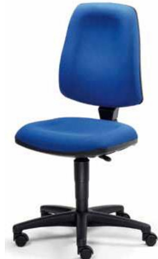
2213 S, 26 272