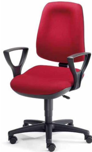
2213 S BS A, 26 271