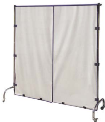
Formate und Preise bitte erfragen!