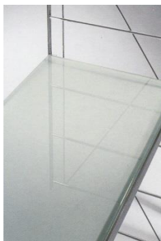
Glasauflagen matt für Rahmen