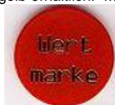
Prägemärke Rund D=30mm