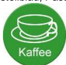
Prägemärke Rund D=38mm

Die Prägemarken sind in den Standardfarben Rot, Blau, Gelb, Lila, Orange, Schwarz, Weiß, Neon-Gelb, Neon-Grün, Neon-Pink, Neon-Blau, Pastellblau, Pastellgrün und Pastellgelb erhältlich. Mindestbestellmenge ist 1000 Stück . Lieferzeit, in der Regel ca. 1 bis 2 Wochen.