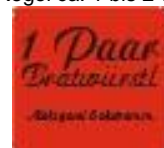
Prägemärke Quadrat 24*24mm