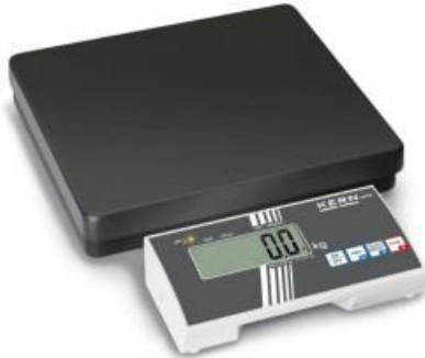
MPB 300K100 mit freistehendem Auswertegerät