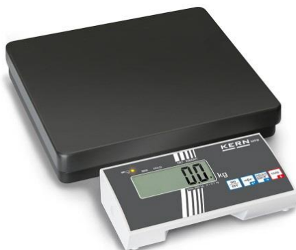
MPB 300K100 mit freistehendem Auswertegerät

Eichung: Die Dauer der Eichung in Tagen ist im Piktogramm angegeben.