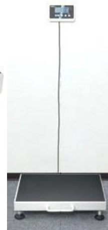
KERN MPC 250K100M, MPC 300K-1M